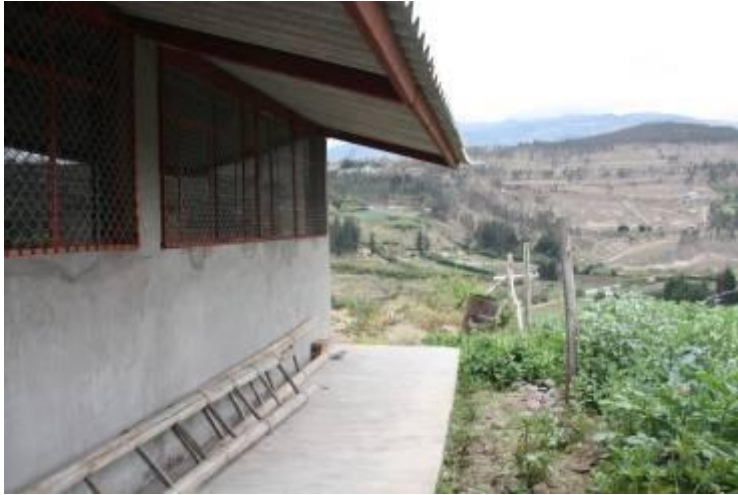
Agosto de 2009

Un año después, en el verano del 2009 la segunda aula estaba prácticamente acabada. Nos queda equiparla con el material necesario para empezar a funcionar el próximo curso.