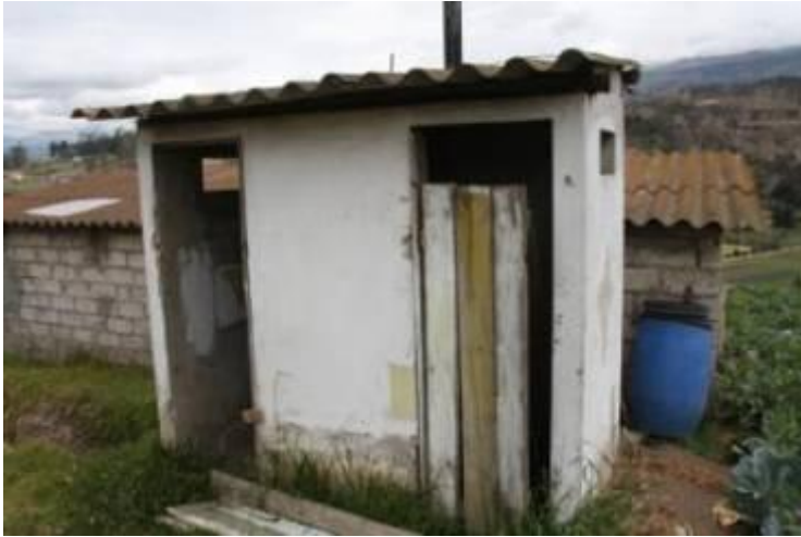
Detalle del WC