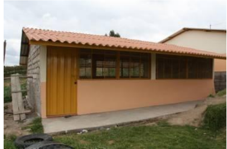
Septiembre de 2009